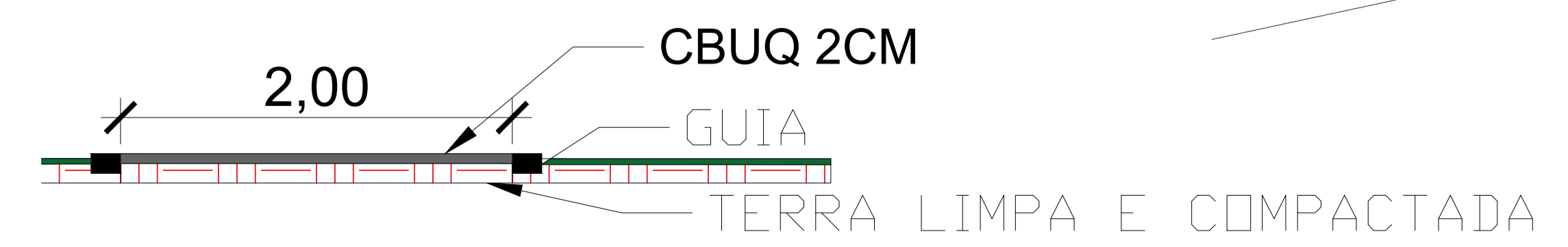
DETALHE PISTA SEM ESCALA